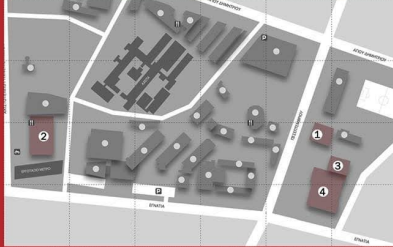
1. ΚΕΔΕΑ 2. ΚΕΝΤΡΙΚΗ ΒΙΒΛΙΟΘΗΚΗ ΑΠΘ 3. ΦΟΙΤΗΤΙΚΗ ΛΕΣΧΗ Α 4. ΦΟΙΤΗΤΙΚΗ ΛΕΣΧΗ Β

Αμφιθέατρο III - Επίπεδο -1, Κέντρο Διάδοσης Ερευνητικών Αποτελεσμάτων (ΚΕΔΕΑ) ΑΠΘ, 3ης Σεπτεμβρίου Θεσσαλονί- κη - Πανεπιστημιούπολη (κόκκινο κτίριο)