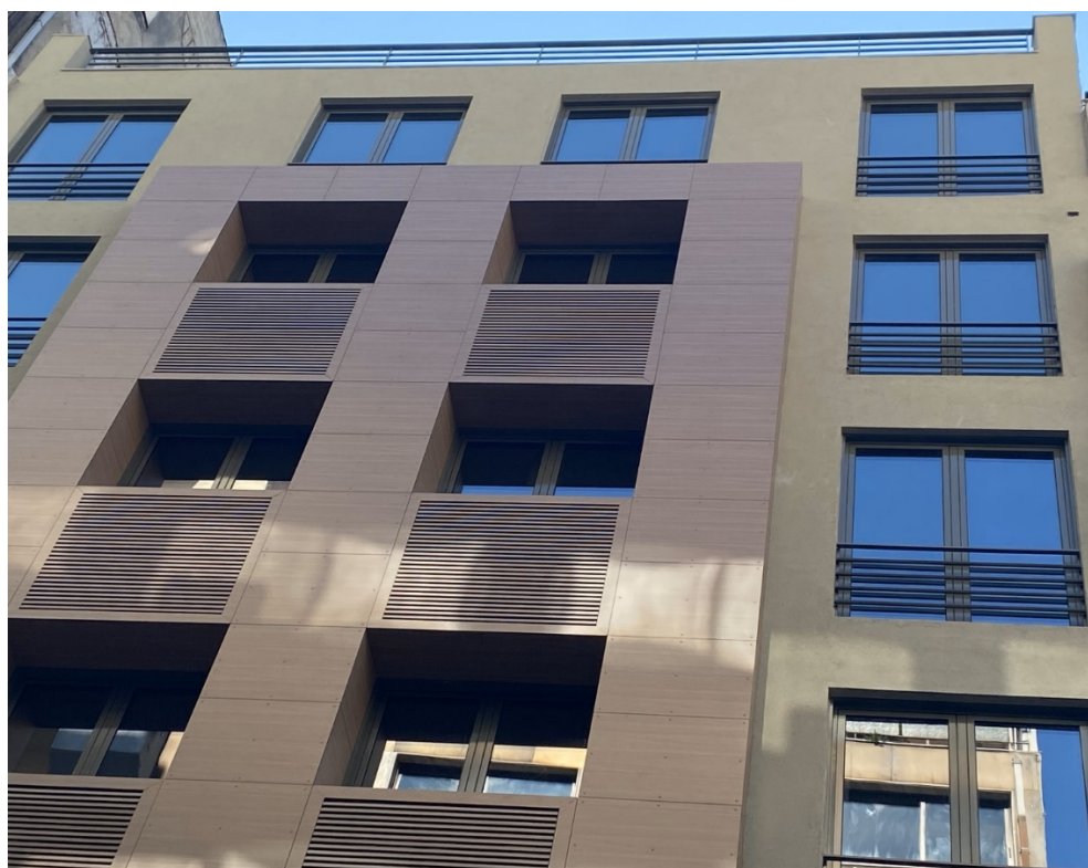
Τμήμα Πολιτικών Επιστημών, κτίριο Β. Ηρακλείου 12