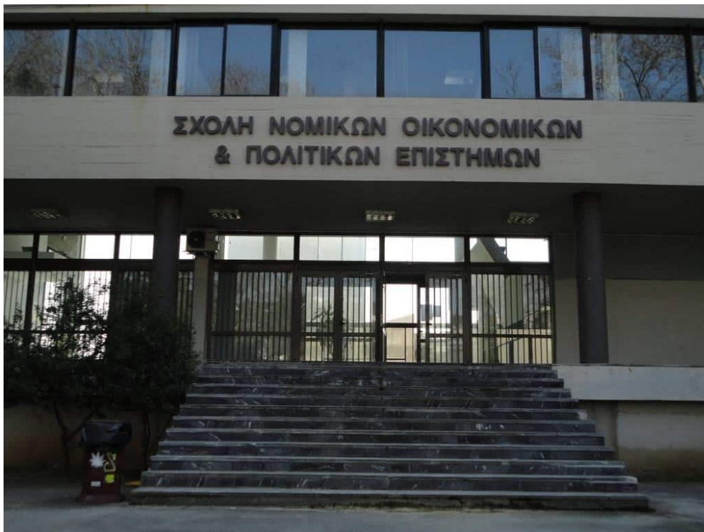
Τμήμα Πολιτικών Επιστημών, κτίριο Νομικής Σχολής και Σχολής Ο.Π.Ε., Πανεπιστημιούπολη